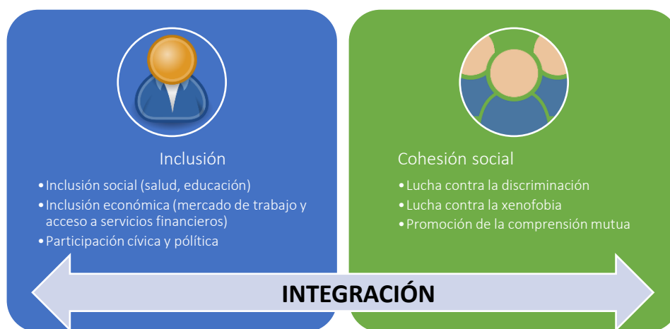
Fig. 1: Elementos de la integración

La integración se define como el proceso bidireccional de adaptación mutua entre migrantes y sociedades de acogida en el que los migrantes se incorporan a la vida social, económica, cultural y política de la comunidad de acogida. Como tal, la integración implica diversas responsabilidades conjuntas para los migrantes y las comunidades de acogida, y, en este entendimiento amplio, incorpora otras nociones conexas, como la inclusión social y la cohesión social. La integración es una cuestión transversal y multisectorial que se refiere a las esferas de políticas que se ocupan de los ámbitos económico, social, jurídico, cultural y cívico, e incide en todos los aspectos de la vida de los migrantes y sus comunidades (véase el gráfico 1).