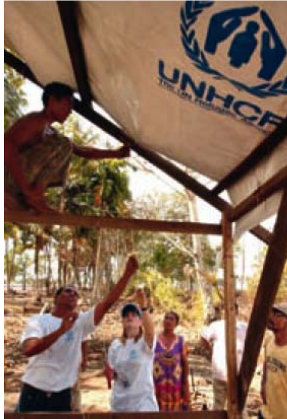
© ACNUR / T. Pengilley / Enero 2005