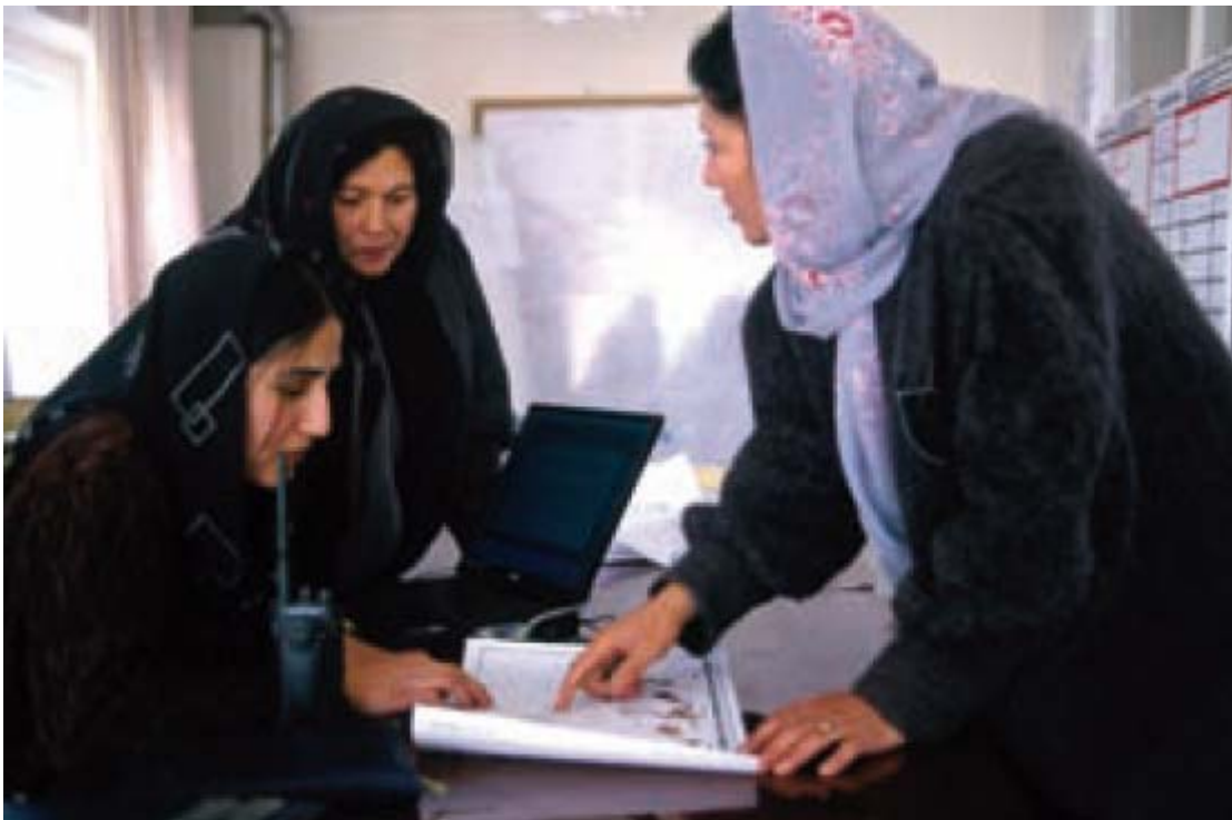
© ACNUR / P. Benatar / 02.2002