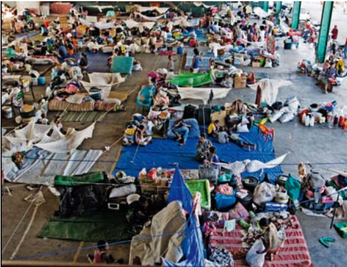
Condiciones de hacinamiento en un campamento espontáneo. Don Bosco College, Dili, junio 12, 2006.