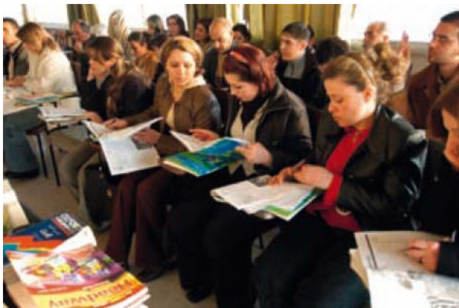
© ACNUR/ ACNUR / J. Wreford / Enero 2007

A medida que pasamos más tiempo con la comunidad, construimos relaciones de trabajo más sólidas con los individuos y representantes de todos los sectores de la comunidad, y ellos se familiarizan con el proceso. Como resultado, mejorará la planificación operativa y por añadidura, nuestra capacidad para brindar protección. El Monitoreo y la evaluación requieren de un diálogo continuo con la comunidad para saber si las respuestas son adecuadas, para confirmar que la comunidad está participando en la implementación y para verificar la calidad de los servicios y si estamos reforzando las capacidades de la comunidad y encontrando soluciones en conjunto.