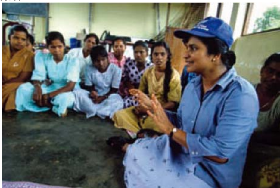
© ACNUR / R. Chalasani/ 10.2002

El diagnóstico participativo es el proceso de formar sociedades con las mujeres y los hombres de todas las edades y orígenes. Por medio del diálogo estructurado y con la participación significativa de los grupos interesados, podemos identificar los riesgos de protección y las áreas prioritarias de acción. Al mismo tiempo, se pueden identificar en conjunto las capacidades y recursos comunitarios para prevenir los riesgos de protección e identificar soluciones, y fijar con claridad las responsabilidades de los agentes externos 37 . Consulte a los representantes de la comunidad antes de realizar un ejercicio de diagnóstico.